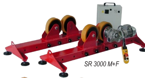
SR 3000 M+F