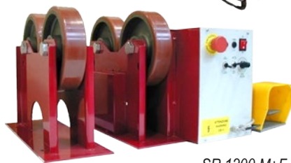
SR 1200 M+F