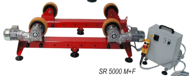
SR 5000 M+F