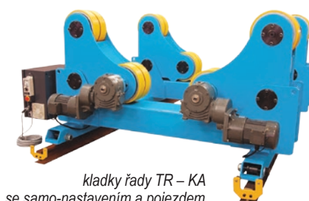
kladky řady TR – KA se samo-nastavením a pojezdem